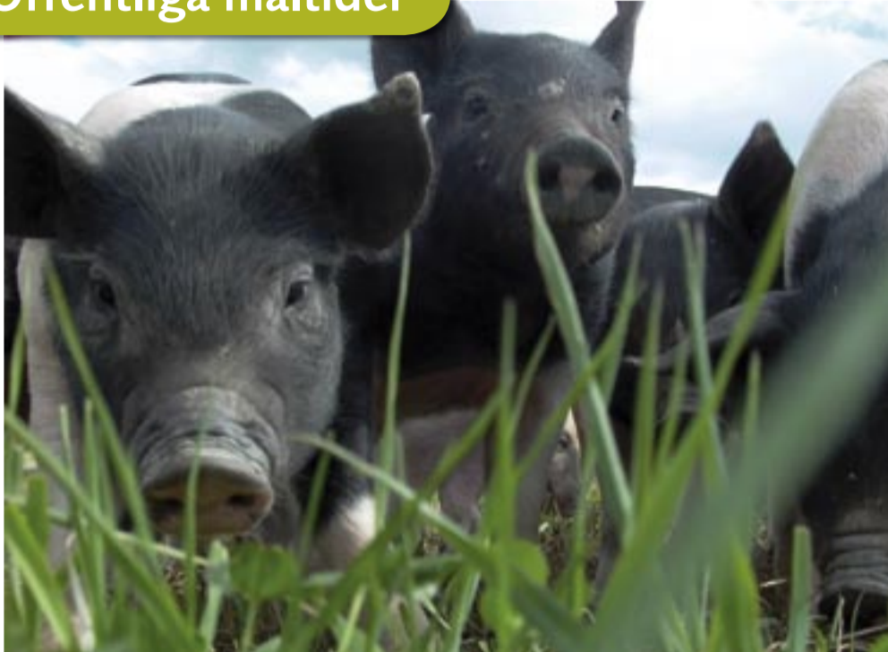
Nyfikna små i gröngräset på Hånsta Östergårde