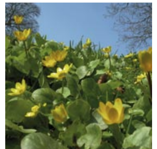
Gulsippor kan ge kreativitet till sammanträdet

I Jönköpings kommun har nu en strategigrupp bildats som ska ta fram ett kvantitativt mål för ekologisk mat och en arbetsplan för hur målet ska nås. Än är inget bestämt, men det finns förslag att Bondens Ekologi utbildningar kommer att nyttjas som redskap för att öka kunskapen och engagemanget för fler inom kommunen. Andra förslag inom strategigruppen är att arbeta aktivt med upphandling samt ekologiska aktivitetsdagar.