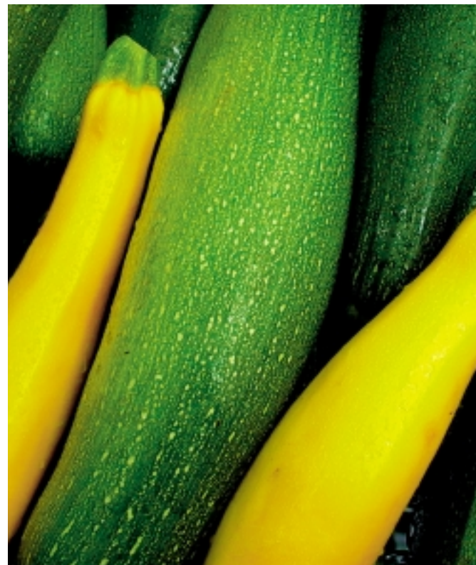
Ekologisk squash för att nå de nationella miljö kvalitetsmålen

KRAV är det vanligaste kontrollmärket för ekologisk mat i Sverige. KRAV kontrollerar och märker varor från ekologiska lantbrukare.