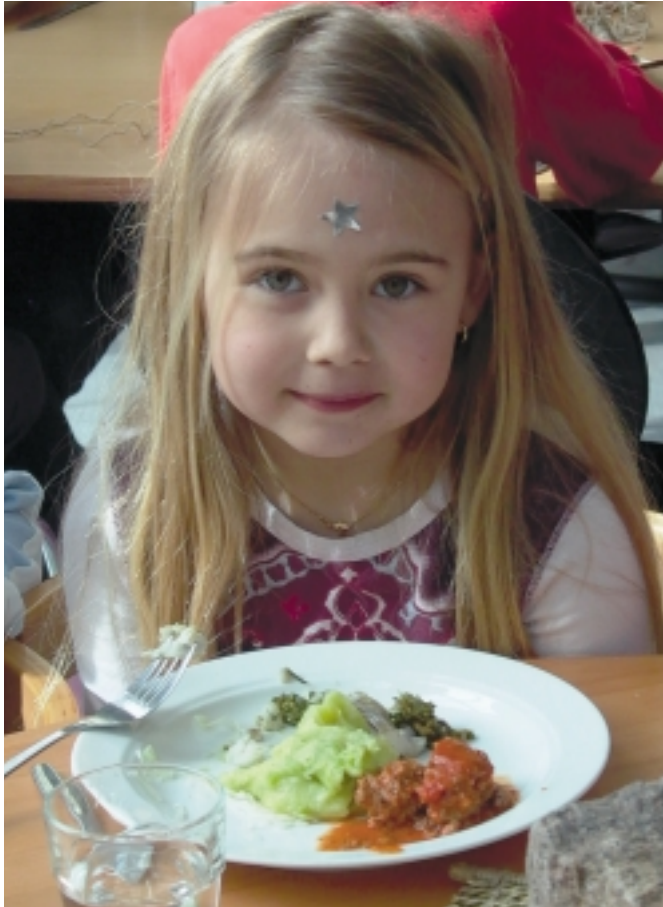
Ekologisk skollunch på Alfaskolan

Grön Flagg är ett projekt för miljöcertifiering av skola och förskola inom Stiftelsen Håll Sverige Rent. De deltagande skolorna kan välja på fem temaområden; kretslopp, vatten, energi, skog