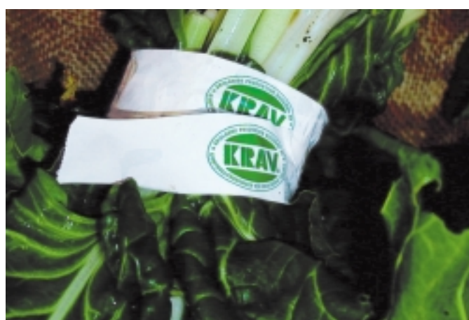
Det ska blir mer KRAV-märkt i Stockholms stad

För mer information om butikseventet Ekobonde på besök se grön ruta på baksidan.