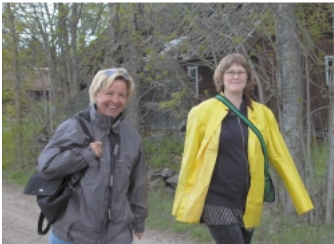
Nöjda deltagare på utbildningen Bondens Ekologi på gården Hånsta Östergårde

I Munkfors Kommun har både kökspersonal på skolor och sjukhem gått utbildningen Bondens Ekologi på Torfolk Gård.